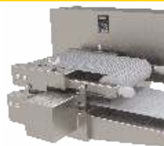
TABLERO DE CONTROL