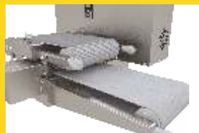
REGULACIÓN DEL ESPESOR DE FILET