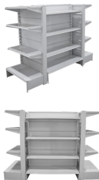
Tramo Puntera 1.54 mts